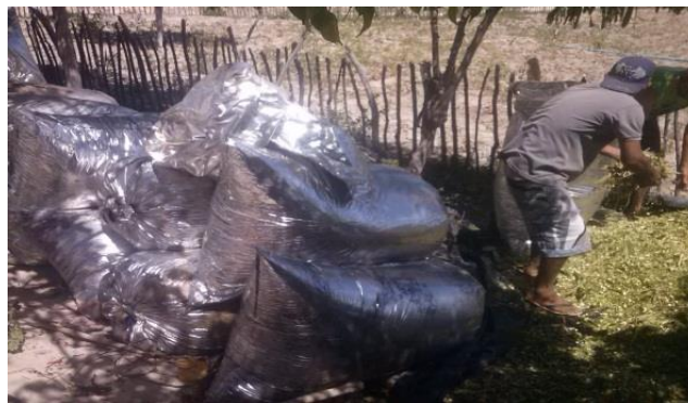
Figura 3: Armazenamento para a pré-secagem.

O processo é realizado com o corte das plantas e a trituração. Após isso há o endurecimento e a pré-secagem, ou armazenamento. Como se vê na figura abaixo. Pode-se observar também o risco ao qual o trabalhador está exposto pela poeira liberada no processo.