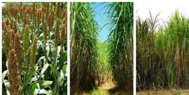
Figura 1: Gramíneas, alimento para ruminantes

A figura 1 revela as gramíneas que são utilizadas na produção de forragem.