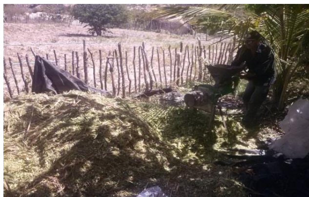
Figura 2 – Trituração das Gramíneas. Patos, 2014

Chamado de forragem pelo processo de trituração de várias gramíneas nas máquinas forrageiras, além de servir de alimento ao gado o material que fica jogado ao solo serve de fertilização e para melhor acomodação dos animais, onde pode se nota o processo na figura 2.