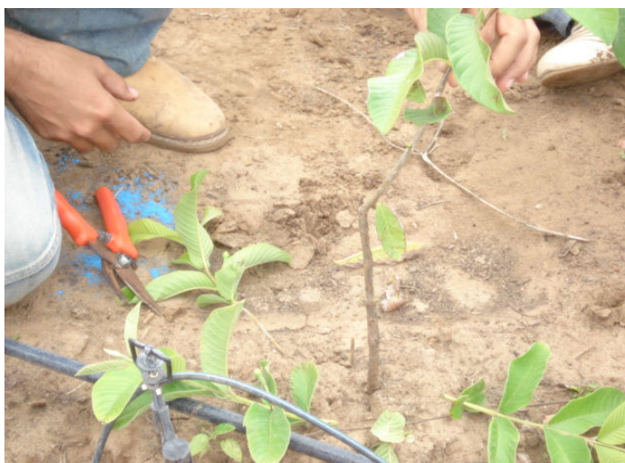
Figura 07 – Poda de formação IFRN, Campus de Ipanguaçu, 2009.