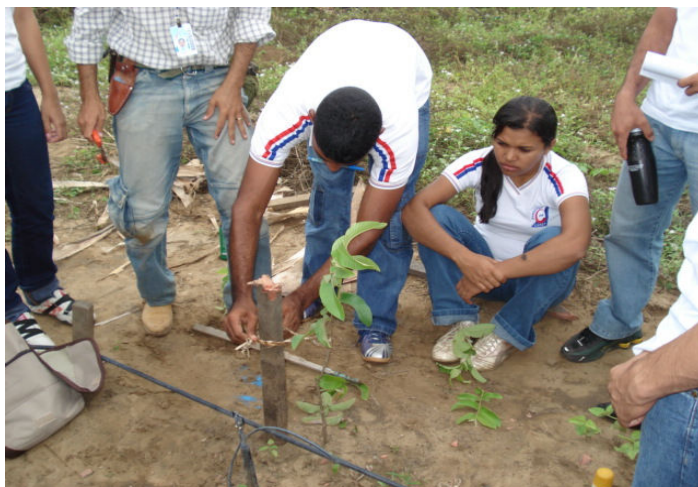
Figura 04 – Resultado do tutoramento IFRN, Campus de Ipanguaçu, 2009