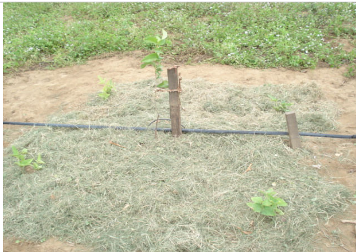
Figura 06 – Cobertura morta. IFRN, Campus de Ipanguaçu, 2009