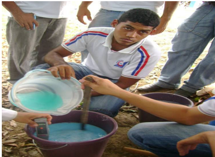
Figura 11 – Medindo o pH. IFRN, Campus de Ipangaçu, 2009.