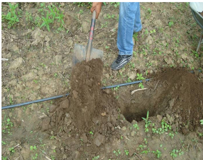
Figura 01 – Aplicação de composto. IFRN, Campus de Ipanguaçu, 2009.