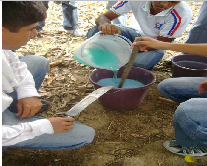
Figura 10 – Medindo a acidez. IFRN, Campus de Ipangaçu, 2009

GRUPO VERDE DE AGRICULTURA ALTERNATIVA (GVAA) - GRUPO VERDE DE AGROECOLOGIA E DESENVOLVIMENTO SUSTENTÁVEL (GVADS) - UNIVERSIDADE FEDERAL DE CAMPINA GRANDE (UFCG)