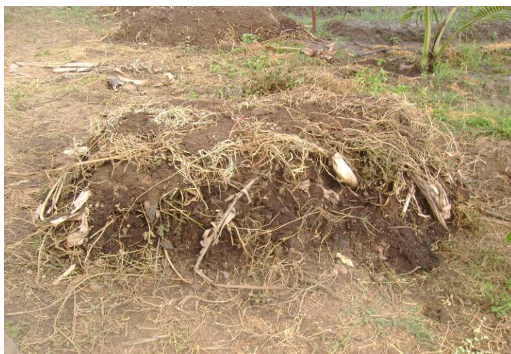
Figura 05 – Composto orgânico. IFRN, Campus de Ipanguaçu, 2009.