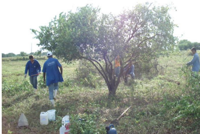
Figura 09- Poda de rejuvenescimento IFRN, Campus Ipangaçu, 2009.