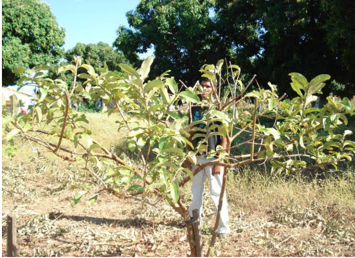
Figura 08- Poda de condução IFRN, Campus de Ipangaçu, 2009.

GRUPO VERDE DE AGRICULTURA ALTERNATIVA (GVAA) - GRUPO VERDE DE AGROECOLOGIA E DESENVOLVIMENTO SUSTENTÁVEL (GVADS) - UNIVERSIDADE FEDERAL DE CAMPINA GRANDE (UFCG)