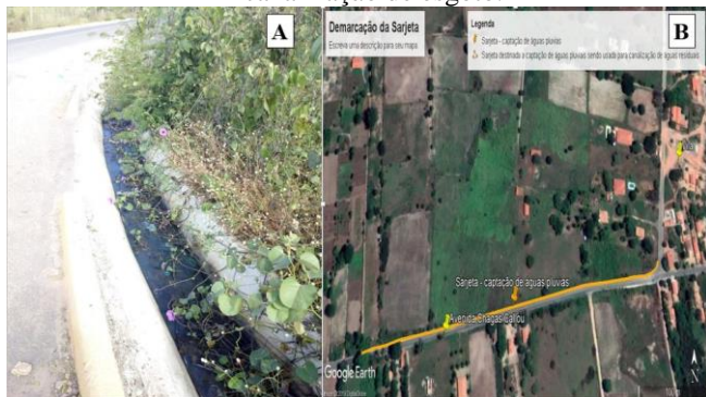
Figura 5: Sarjetas de drenagem pluvial usada como canalização de esgoto.

semelhante é observado na Avenida Chagas Callou, onde a sarjeta de drenagem pluvial é utilizada para canalização de esgoto (Figura 5).