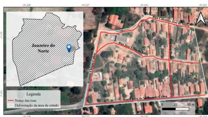
Figura 2: Localização da Vila Maria Célia Callou, Juazeiro do Norte.