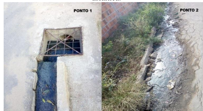
Figura 4: Pontos de esgoto em rua com pavimentação asfáltica.

Como definido pela ABNT (1986), entende-se como esgoto doméstico o despejo líquido resultante do uso da água de abastecimento, para atividades de higiene e necessidades fisiológicas humanas. Na área rural em análise, os lançamentos observados incluem água de banho e lavagens em geral, contendo detergentes e químicos de limpeza. Pela Figura 4, é possível observar registros de lançamento desse tipo de efluente em rua com pavimentação asfáltica.