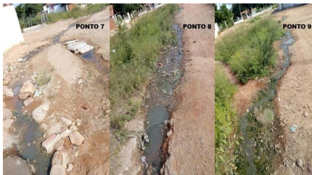
Figura 7: Pontos de esgoto em sem pavimentação asfáltica.