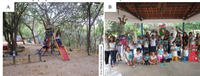
Figura 5. Recreação (A) e entrega do livro e da tartaruga (porta bombons) (B). Catolé do Rocha-PB, 2016.

Ao término da visita, houve a entrega de um livro, com o objetivo de estimular a leitura, e uma tartaruga (porta bombons) feita de garrafa PET (Figura 5 B), enfatizando o reuso de resíduos para confecção de utensílios.