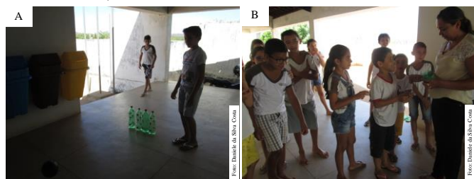
Figura 2. Jogo matemático com garrafas PET (A e B). Catolé do Rocha-PB, 2016.

Dessa forma, com auxílio de materiais recicláveis (garrafas PET) trazidos pelos próprios alunos para a confecção de um jogo matemático, a turma foi levada para o pátio da escola, onde o material foi utilizado de forma lúdica, alcançando a aprendizagem a partir de uma brincadeira (Figura 2 A, B). Como atividade extraclasse, os educandos fizeram interpretação de um texto abordando a importância da reciclagem.