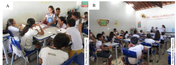
Figura 1. Confeção de cartazes (A) e apresentação (B). Catolé do Rocha-PB, 2016.

Há projetos e indicações argumentando a importância da EA como componente escolar, diante de toda a problemática ambiental hoje, e que sua inclusão, como disciplina, poderá produzir resultados mais efetivos para a tomada de consciência sobre a necessidade de preservação do meio ambiente ou do desenvolvimento sustentável (BERNARDES e PRIETO, 2010).