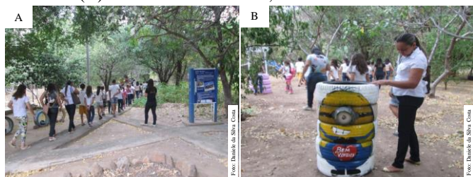
Figura 3. Visita ao Projeto Xique-Xique (A) e Material reciclado (B). Catolé do Rocha-PB, 2016.

Leitura e produção textual é um conjunto de habilidades que proporciona uma vivência ativa na sociedade, sendo fundamental em qualquer componente curricular (SILVA e ALVES, 2016). Após a observação dos aspectos ecológicos naturais e artificiais, os alunos foram direcionados à biblioteca, onde realizaram uma produção textual, redigindo o que vivenciaram nas aulas teóricas e práticas (Figura 4).