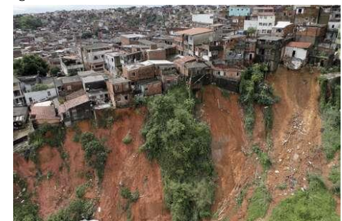
Figura 4 - Ocupação de áreas de risco.

Outros exemplos de uso e ocupação do solo em áreas urbanas são mostrados nas FIGS. 4 e 5. Nesses casos, a população se encontra ameaçada pelo risco de acidentes e perdas econômicas devido à inadequação e vulnerabilidade das áreas em questão.