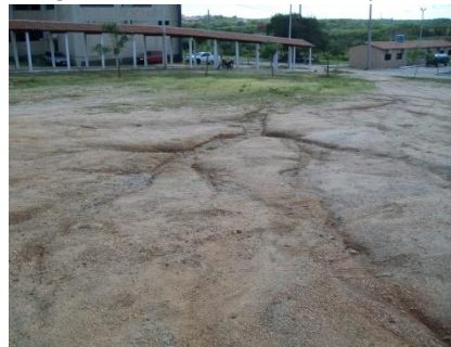
Figura 1 - Erosão do solo no CCTA/UFPG.

Nas FIGS. 1, 2 e 3 apresentam-se exemplos de uso e ocupação do solo de forma desordenada, o que contribui para diversos impactos ambientais, conforme citado anteriormente.