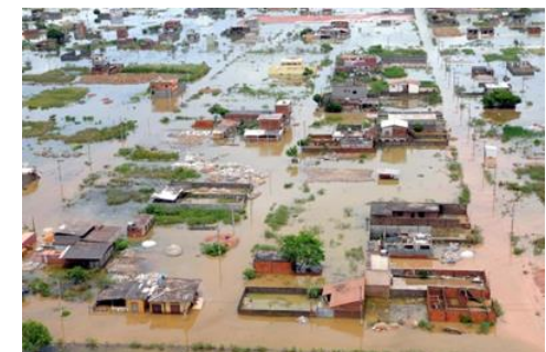
Figura 5 - Inundação em área urbana.