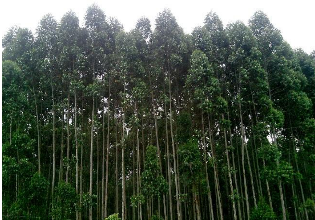
Figura 3 – Monocultura de eucalipto que tem alta taxa de transpiração e, portanto, altera os recursos hídricos.