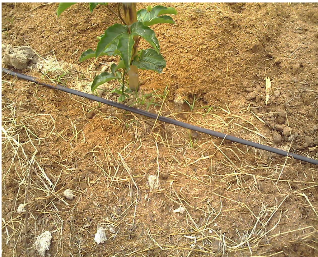
Figura 4 – Exemplo de irrigação por gotejamento em maracujazeiro. A água, que sai por um furo na mangueira, é racionalmente utilizada somente para irrigar a região da raiz.

Martins et al. (2007) verificaram que a irrigação deste tipo, em virtude destas vantagens, melhora a produção do cafeeiro, entretanto a mesma deve ser manejada adequadamente para não ocorrer perda da produção e do lucro.