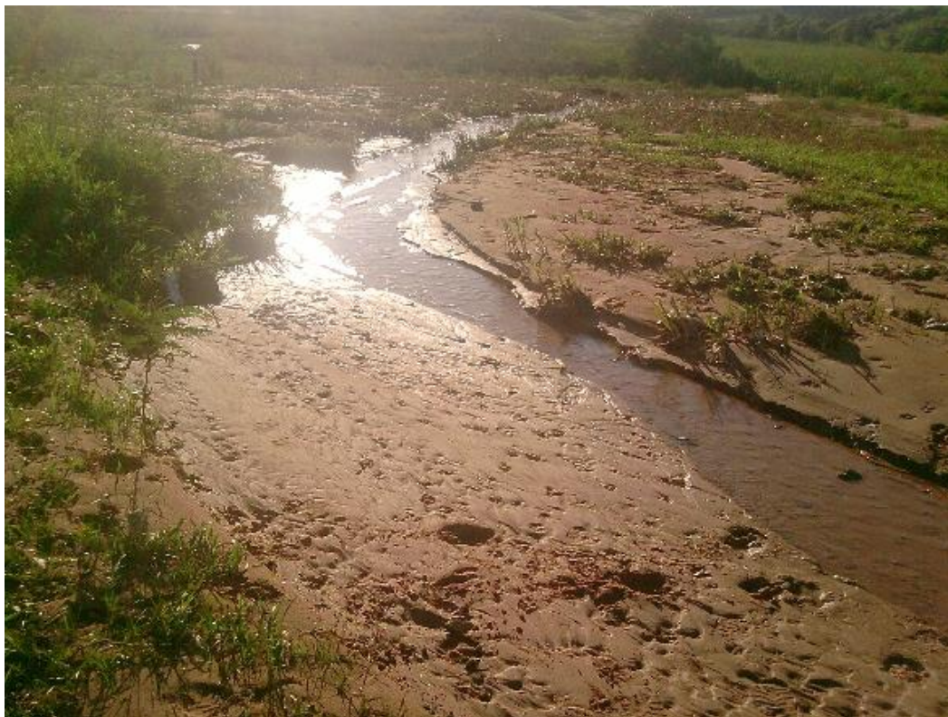
Figura 1 – Assoreamento de um córrego devido à retirada da mata ciliar para, então, o usar o solo para o plantio de cana-de-açúcar.

Associado a esses problemas, está o uso de agrotóxicos de maneira inadequada. São reconhecidos os esforços no sentido de se colocarem produtos menos agressivos no mercado de agroquímicos ou até mesmo de se utilizar inseticidas ou herbicidas naturais, mas que ainda são produtos mais caros, portanto, menos consumidos.