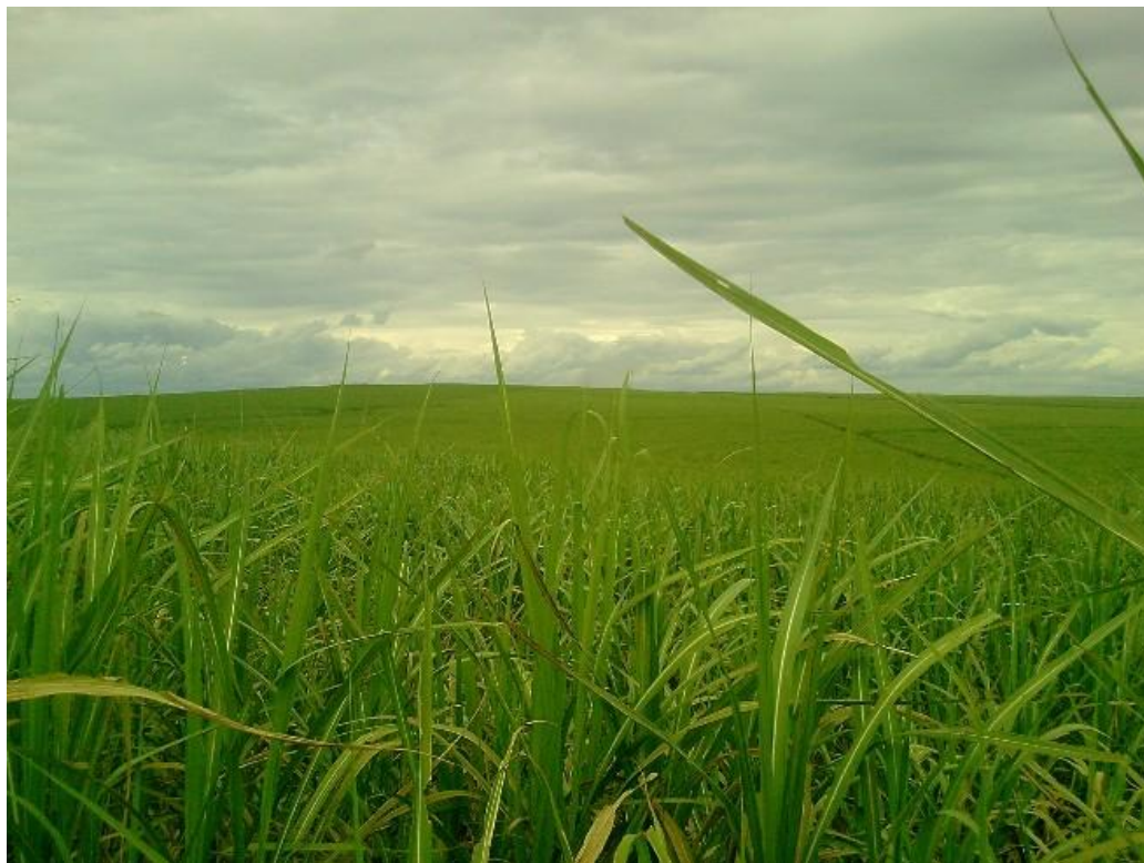
Figura 2 – Monocultura de cana-de-açúcar, a qual altera as propriedades físicas do solo, devido à produção intensiva e prolongadas.