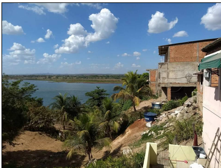
Figura 3 - Construções realizadas nas margens do rio Francisco em Propriá.

Logo, estas condições estão intrinsecamente ligadas ao panorama de salubridade ambiental do município, onde o uso e ocupação do solo, deve ser controlado, a fim de melhor distribuir e destinar os serviços de saneamento. A Figura 3 mostra ocupações e construções de residência realizadas nas margens do rio Francisco, ao lado da BR 101, no município de Propriá.