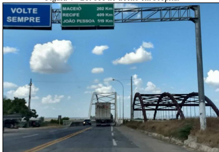
Figura 4 - BR 101 no trecho em Propriá.

sobre o rio São Francisco. Sendo que o local é passagem obrigatória para o transporte terrestre entre diversos estados do Nordeste brasileiro.