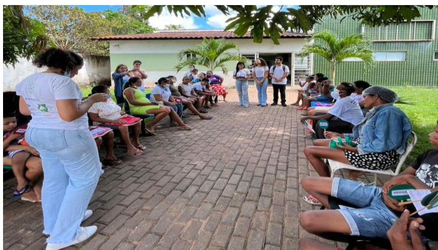
Figura 3: Realização da dinâmica de “Mito ou Verdade” durante ação sobre o Uso Racional de Medicamentos.

do Uso Racional de Medicamentos, comemorado na data 05 de maio, em uma UBS da zona rural de Teresina. Para isso, os discentes realizaram uma discussão com os usuários em espera para consulta, onde foram abordados pontos acerca da função e utilização prudente dos medicamentos, prática da automedicação, as consequências do uso irracional de medicamentos e como proceder com seu descarte correto. Na ocasião, foram utilizados como recursos folders informativos e a dinâmica de “Mito ou Verdade” com o uso das plaquinhas (Figura 3).