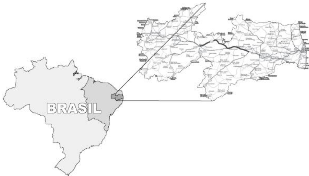
Figura 1. Localização do trecho da Rodovia BR-230 objeto do estudo, conforme destaque no mapa da Paraíba.

A população pesquisada foi constituída por 31 produtores rurais responsáveis pelas áreas de produção agrícola localizadas nas faixas de domínio da Rodovia BR-230 no trecho avaliado. A seleção dos indivíduos para compor o estudo foi realizada de forma aleatória não probabilística de acordo com a conveniência, uma vez que foram entrevistados todos os produtores que estavam presentes nas áreas de produção no momento da pesquisa. Dessa forma, a amostra foi composta por 11 produtores que eram responsáveis por 12 das 32 áreas de produção, o que equivale a 35,48%. Um dos produtores era responsável por duas áreas produtivas.