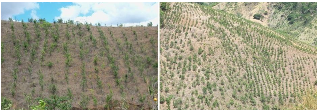
Figura 3. Plantio de laranja lima sem respeitar as curvas de nível em Santana do Mundaú - AL. Santana do Mundaú-AL, 2013.

Visando contribuir para o desenvolvimento da agricultura e pecuária no Estado de Alagoas, o governador do Estado assinou, no dia 12 de agosto de 2011, o Projeto de Lei que aprova a criação do Instituto de Inovação para o Desenvolvimento Rural Sustentável, baseada nos moldes da antiga EMATER (Empresa de Assistência Técnica e Extensão Rural), que foi extinta no estado na década de 90. Assim, segundo a Secretária de Estado da Comunicação – SECAL (2011), o Instituto será responsável pela prestação de serviços de pesquisa, assistência técnica e extensão rural aos agricultores alagoanos.