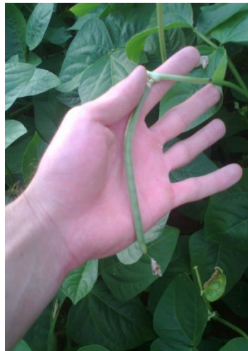
Figura 3 - Enchimento dos grãos