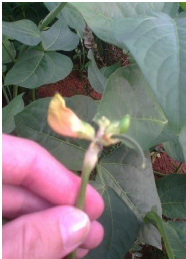
Figura 2 - Floração do feijão Caupi