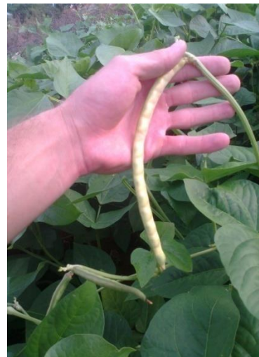
Figura 4 - Vargem (finalização da produtividade)