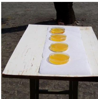
Figura 2. Exposição do corante Remazol Amarelo RNL 150% à radiação solar

Para avaliar a descoloração e a degradação das amostras, a Espectroscopia UV-visível (Espectrômetro Aquamater, Merck) foi a principal técnica analítica empregada. Para avaliar a descoloração das soluções foram observados o decaimento das absorvâncias medidas num comprimento de onda de 415 nm, 518 nm e 597 nm para RGY, utilizando-se cubetas de quartzo de 1 cm de caminho ótico.