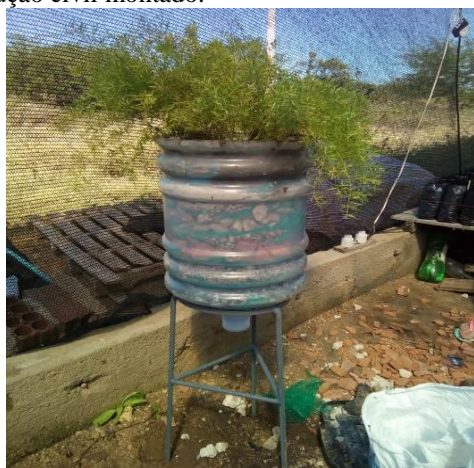
Figura 2. Sistema de alagado construído com resíduos da construção civil montado.

das dimensões das camadas foram feitas de maneira a preencher todo o garrafão de acordo com a área útil, utilizando camadas mais grossas para o solo (cultivo das plantas), concreto e tijolos. E mais finas para os demais materiais. A figura 2 apresenta o sistema em sua forma finalizada, após as montagens das camadas dos materiais filtrantes do sistema.