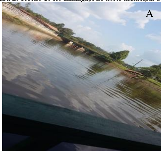
Figura 2. Trecho do rio Inhangapi no horto municipal de Inhangapi, Pará.

A Figura 2 A demonstra o fluxo do rio Inhangapi e a Figura 2 B a presença de construções de alvenaria às margens do rio e retirada da mata ciliar.